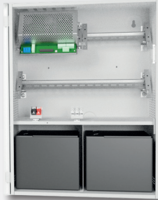
Enhet med 40Ah batterier